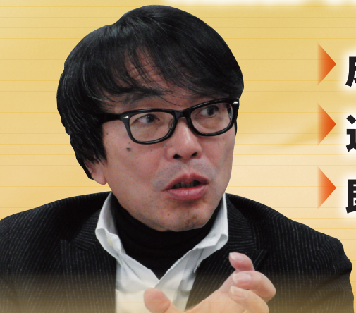
元(株)オートバックスセブン取締役 現(株)船井総合研究所 客員コンサルタント