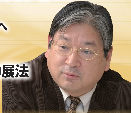
(株)船井総合研究所 代表取締役会長